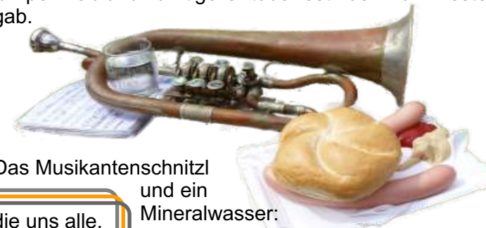
Das Musikantenschnitzl und ein Mineralwasser: Die klassische Musikantenkost!

Am 2. Oktober 2011 wurde im Ameiser Dorfwiazhaus ein originelles Erntedank- und Oktoberfest gefeiert. Vom Veranstalter wurde von Lebkuchenherzen über gegrillten Ochsen und Bandtanz bis zu Weißwürsten mit Brezn alles aufgeboden, was ein richtiges Oktoberfest ausmacht. Musikalisch wurde das Oktoberfest in Form eines Fröhschoppens vom Ortsmusikverein Ameis-Föllim-Altruppersdorf gestaltet, der sich auch nicht lumpen ließ und zünftige Oktoberfestmusik zum Besten gab.